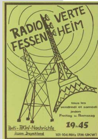
RVF sendet Freitags und Samstags um 19.45 (1977/78)

Auch RVF will keine Eintagsfliege bleiben, sondern regelmäßig senden und das Themenspektrum erweitern. Ohnehin falsch ist das oft gehörte Etikett von RVF als ‚Ökosender‘, denn für viele war der Kampf gegen Atomkraft mit einer grundlegenden Systemkritik verbunden. Ging es nicht um eine von Politik und Kapital im globalen Maßstab betriebene Schlüsseltechnologie? Sehr sensibel wurden die besonders harten Polizeieinsätze in Frankreich gegen kleine Anti-AKW-Demonstrationen registriert.