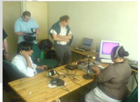
Internationale Redaktion im Studio.

Beteiligten vorher kannten – von E-Mail-Orga-Listen abgesehen – trifft dies auch auf das movin G8 Radioforum zu. Die deutschsprachige Redaktion wirkte schon am Montag, dem Aktionstag Migration, als würden die Radiomachenden seit Jahren zusammenarbeiten. In morgendlichen und abendlichen Plena wurden die Aufgaben des nächsten Tages verteilt. Dabei entwickelten sich manche zu SpezialistInnen für bestimmte Aufgaben, gaben diese aber auch wieder ab. Über die Woche verteilt schlüpfen die Beteiligten in die unterschiedlichsten Rollen: Moderator, Strassenreporterin, Chefin vom Dienst, Koordinator der Radios oder Technikerin. Zeit zum Austauschen über die alltägliche Radioarbeit daheim blieb nicht viel, dafür umso mehr gemeinsam produzierte Sendestunden.