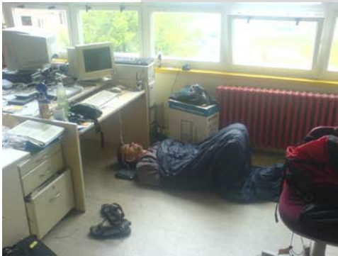
Das Radioforum war Arbeits- und Schlafplatz zugleich.

Der Gipfel ist vorbei und in den freien Radios kehrt das Alltagschaos zurück. Doch bleibt etwas zurück: die Erfahrung des movin G8 Radioforum. Über eine Woche lang Zusammenarbeit von über 50 Radiomachenden aus 14 verschiedenen Ländern und unzähligen Community Radios weltweit. Allein im deutschsprachigen Raum strahlten im Verlauf der Woche 17 freie Radios den Internetstream des Radioforums aus. Über UKW war die alternative Berichterstattung auf vier Kontinenten zu hören: Berichte über die Proteste und vielfältigen Aktionsformen gegen den G8 Gipfel, zu Themen wie globale Landwirtschaft, Migration, Krieg und Militarisierung oder Sozialabbau und über die Repression der Polizei. Dahinter steckte ein immenser technischer Aufwand, der nur durch die wochenlangen Vorarbeiten mehrerer Technikgruppen möglich war.