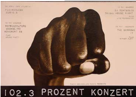
Plakat zu einer RDL-Konzertreihe (1994)

DVD-ROM für PC (Windows), Mac und Linux-Rechner, mit Begleitheft. Barrierefreie Darstellung. Erhältlich unter: presse@rdl.de , Unkostenbeitrag 7,- €