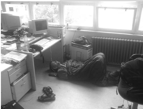
Das Radioforum war Arbeits- und Schlafplatz zugleich.

Der Gipfel ist vorbei und in den freien Radios kehrt das Alltagschaos zurück. Doch bleibt etwas zurück: die Erfahrung des movin G8 Radioforum. Über eine Woche lang Zusammenarbeit von über 50 Radiomachenden aus 14 verschiedenen Ländern und unzähligen Community Radios weltweit. Allein im deutschsprachigen Raum strahlten im Verlauf der Woche 17 freie Radios den Internetstream des Radioforums aus. Über UKW war die alternative Berichterstattung auf vier Kontinenten zu hören: Berichte über die Proteste und vielfältigen Aktionsformen gegen den G8 Gipfel, zu Themen wie globale Landwirtschaft, Migration, Krieg und Militarisierung oder Sozialabbau und über die Repression der Polizei. Dahinter steckte ein immenser technischer Aufwand, der nur durch die wochenlangen Vorarbeiten mehrerer Technikgruppen möglich war.