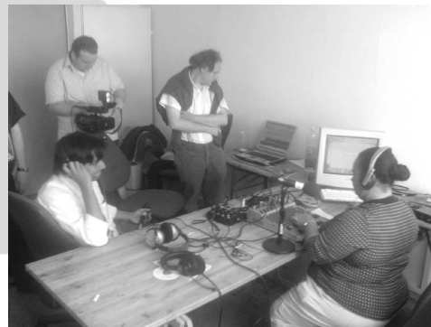
Internationale Redaktion im Studio.

Beteiligten vorher kannten – von E-Mail-Orga-Listen abgesehen – trifft dies auch auf das movin G8 Radioforum zu. Die deutschsprachige Redaktion wirkte schon am Montag, dem Aktionstag Migration, als würden die Radiomachenden seit Jahren zusammenarbeiten. In morgendlichen und abendlichen Plena wurden die Aufgaben des nächsten Tages verteilt. Dabei entwickelten sich manche zu SpezialistInnen für bestimmte Aufgaben, gaben diese aber auch wieder ab. Über die Woche verteilt schlüpfen die Beteiligten in die unterschiedlichsten Rollen: Moderator, Strassenreporterin, Chefin vom Dienst, Koordinator der Radios oder Technikerin. Zeit zum Austauschen über die alltägliche Radioarbeit daheim blieb nicht viel, dafür umso mehr gemeinsam produzierte Sendestunden.