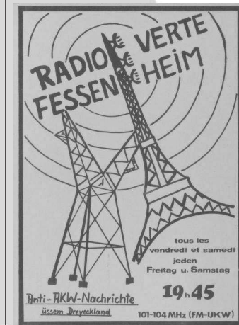
RVF sendet Freitags und Samstags um 19.45 (1977/78)

Auch RVF will keine Eintagsfliege bleiben, sondern regelmäßig senden und das Themenspektrum erweitern. Ohnehin falsch ist das oft gehörte Etikett von RVF als ‚Ökosender‘, denn für viele war der Kampf gegen Atomkraft mit einer grundlegenden Systemkritik verbunden. Ging es nicht um eine von Politik und Kapital im globalen Maßstab betriebene Schlüsseltechnologie? Sehr sensibel wurden die besonders harten Polizeieinsätze in Frankreich gegen kleine Anti-AKW-Demonstrationen registriert.