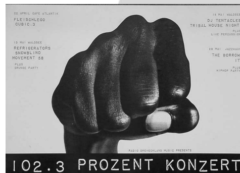
Plakat zu einer RDL-Konzertreihe (1994)

RDL versteht sich noch immer als politisches Projekt und richtet sich auch gegen die zunehmende Tendenz der Landesmedienanstalt in die Programmhoheit der Radios einzugreifen (etwa Fördermittel an ‚regionale‘ Berichterstattung zu knüpfen). Zudem betrachtet RDL mit Sorge, dass im nichtkommerziellen Bereich immer stärker brave Bürgerradios gefördert und als Konkurrenz gegenüber den unbequemen freien Radios aufgebaut werden. Hier wäre auch vom BFR eine entschiedenere Gangart zu wünschen.