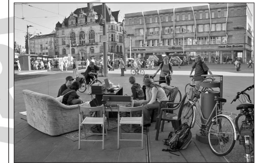
Corax-Außenstudio auf dem Marktplatz

Was bewirkt mediale Öffentlichkeit im „Begleitmedium“ Hörfunk?