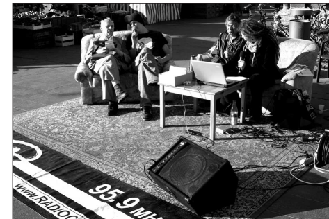
Morgenmagazin live auf dem Marktplatz

Und trotzdem gab es wenigstens für mich erstmals das Gefühl, dass sich Radio auch stadtweit komplett dem System von Ware und Geld, von Info-Business und Service entziehen kann. Vier Wochen lang wurde Radio zum Erlebnis auf zwei Frequenzen und an über 30 Orten in der Stadt. Vielleicht war es wichtig, im Sinne der russischen Futuristen, auch den höchsten Punkt in der zentralen Innenstadt in Beschlag zu nehmen – den Roten Turm, der auch noch just sein 500-jähriges Jubiläum feierte. Im nämlichen Monat wurde er zum Funkturm; die Sende-Antennen sind in weiser Voraussicht noch jetzt in der Turm-Spitze.