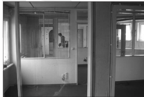
FSK-Studio vor dem Umbau

besteht aber in der Schaffung eines Raums, der so frei wie möglich von sexistischer Marginalisierung, rassistischer Gewalt, klerikalem Geschwätz oder antisemitischen Beleidigungen ist. Der also Konsequenzen zieht aus linker Kritik. Daraus folgt aber, dass Freies Radio nicht frei von Zensur ist. Immer wieder muss sich über die Grundlagen dessen verständigt werden, was im Programm zu hören sein soll und was nicht. Woran sich aber dabei orientieren?