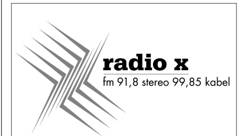
Das nichtkommerzielle Lokalradio für Frankfurt und Umgebung