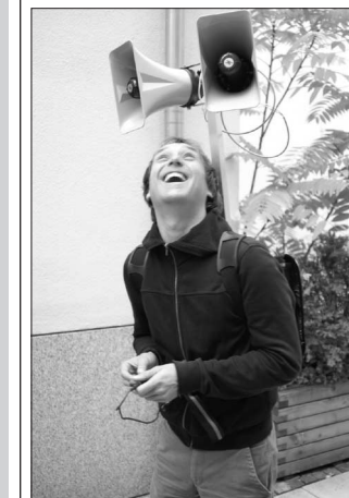
LIGNA in Aktion

Mit diesem Modell hat FSK 1996 eine Teilfrequenz, 1998 eine 6-Tagefrequenz und seit 2001 eine Vollfrequenz auf der 93,0 MHz bekommen. FSK ist im Tagesbetrieb ausschließlich über seine Fördermitglieder finanziert. Es gibt prinzipiell keine festen Stellen; die Aneignung des Radios läßt sich der mehrheitlichen Ansicht nach nicht von Festangestellten vorantreiben. Die Komplexität der FSK-Struktur, ihr post-autonomer Charakter (Verabschieden schein-basisdemokratischer Prinzipien), ist von Anbeginn kritisiert worden. Zugleich hat sie sich aber insbesondere bei inhaltlichen Debatten (Vorrang der Redaktionen vor der AnbieterInnengemeinschaft, kontinuierliche, verbindliche Diskussion) bewährt.