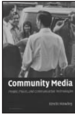
People, Places and Communication Technologies Cambridge, University Press 2005

Weise denn vorhandene medien- und alltagsbezogene Sozialtheorien und -kontexte auf die Realität der Community-Medien Bezug nehmen und ob ihnen das auch in angemessener Weise gelingt. Insbesondere den Cultural Studies, bei denen ja eine hohe Affinität zu widerspenstigen Medienpraktiken angenommen werden kann, wirft er vor, bisher überraschend wenig Verständnis für die Bedeutung von Community-Medien entwickelt zu haben. Sein eigenes Konzept von Community-Medien als „socio-cultural mediation“ klingt zunächst auch recht banal, ihm gelingt es jedoch, dies in die Kontexte aktueller, kritischer Diskussionen um Globalisierung, Medien und Demokratie einzuordnen. Entgegen allen Einseitigkeiten erzählt er unter anderem sehr schön, wie die eigentlich absurden Theorien McLuhans, die sich insbesondere keinen Dreck um solche Fragen wie übermächtige Medieninstitutionen gewidmet haben, doch als Auslöser für den Video-Untergang der späten 60er Jahre fungierten – neben der Begeisterung, die seine Visionen auch unter den damaligen us-amerikanischen business leaders auslösten.