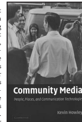
People, Places and Communication Technologies Cambridge, University Press 2005

Weise denn vorhandene medien- und alltagsbezogene Sozialtheorien und -kontexte auf die Realität der Community-Medien Bezug nehmen und ob ihnen das auch in angemessener Weise gelingt. Insbesondere den Cultural Studies, bei denen ja eine hohe Affinität zu widerspenstigen Medienpraktiken angenommen werden kann, wirft er vor, bisher überraschend wenig Verständnis für die Bedeutung von Community-Medien entwickelt zu haben. Sein eigenes Konzept von Community-Medien als „socio-cultural mediation“ klingt zunächst auch recht banal, ihm gelingt es jedoch, dies in die Kontexte aktueller, kritischer Diskussionen um Globalisierung, Medien und Demokratie einzuordnen. Entgegen allen Einseitigkeiten erzählt er unter anderem sehr schön, wie die eigentlich absurden Theorien McLuhans, die sich insbesondere keinen Dreck um solche Fragen wie übermächtige Medieninstitutionen gewidmet haben, doch als Auslöser für den Video-Untergang der späten 60er Jahre fungierten – neben der Begeisterung, die seine Visionen auch unter den damaligen us-amerikanischen business leaders auslösten.